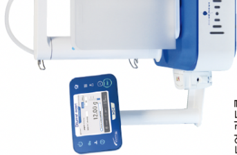
헤드엄 컨트롤 유닛 스탠드