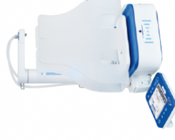
대용량 시료는 용선인 XL 펌프 선택하여, 달루매트 액스퍼트 예보 사용 가능