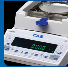
밝고 선명한 VFD 디스플레이