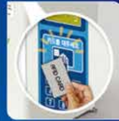
RFID 카드에 의한 배출원 인식