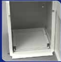
전자저울에 의한 정확한 계량