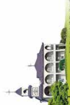
CAS Building (Gulshan Hitech)