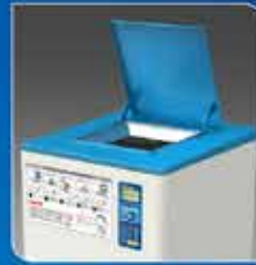
상단 투입구 자동 문 열림/닫힘