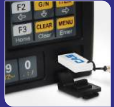
USB 데이터 백업