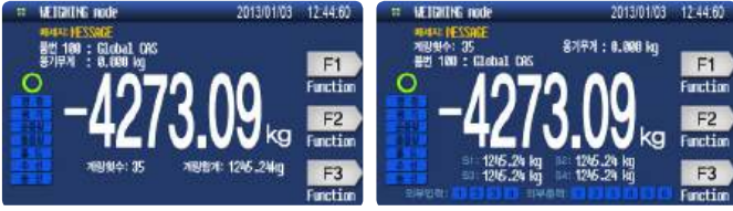
〈Simple Type CI-601A〉