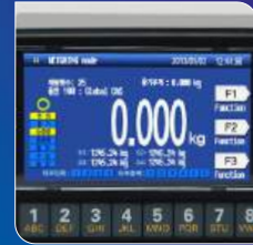
사용자 친화적 인터페이스