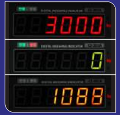
3색 LED 디스플레이 (적색, 녹색, 황색)