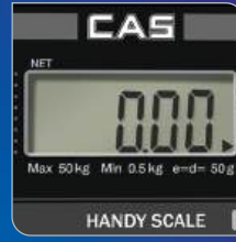
선명한 LCD 디스플레이