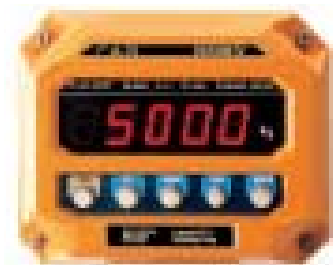
▲ 表示部及びキーボード部