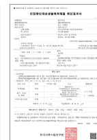
안전확인대상 생활화학제품 확인결과서

안심하세요! 이제, 카스 에어메디가 있는 공간은 30초 마다 실시간으로 방역됩니다!