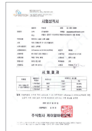
신종플루 30초 처리 99.98%사멸 효능 성적서