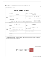
안전기준 적합확인 신고증명서