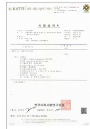
폐렴균 30초 처리 99.9%사멸 효능 성적서