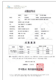
코로나19 30초 처리 99.99%사멸 효능 성적서