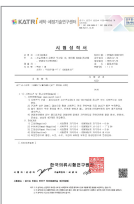
피부자극 안정성 테스트 성적서