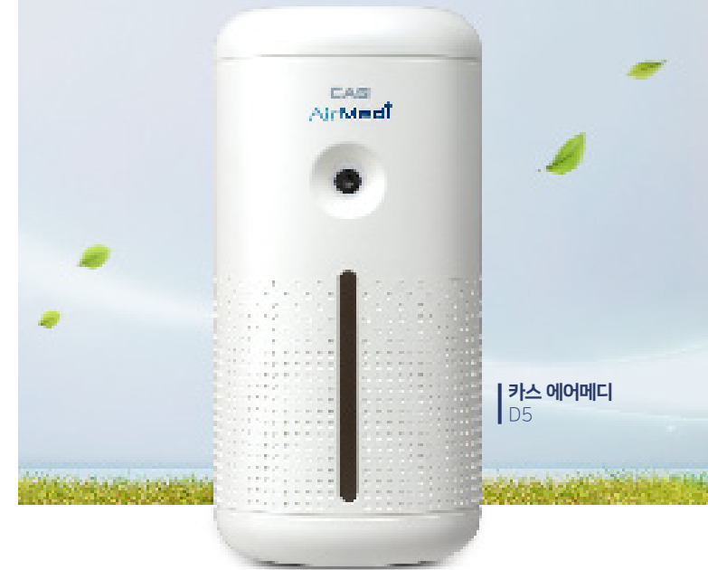
카스 에어메디 D5