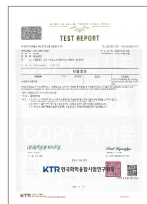
급성경구독성 시험 합격 성적서