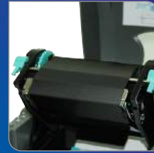
Thermal Transfer/ Direct Thermal 호환