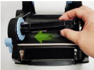
교체가 편리한 리본 모듈

BLP-401/HT300은 물류 / 유통 / 제품생산 등 산업용 라벨업무에 필요한 바코드 프린터입니다. Thermal Transfer / Direct Thermal 의 두가지 인쇄모드를 제공하며 사용자 편의를 위한 인터페이스와 강한 내구성을 갖추었습니다. 또한 다양한 통신사양(USB, RS-232, Ethernet)과 액세서리(라벨롤 홀더, 커터모듈, 필러 모듈)로 제품의 호환성을 높였습니다.