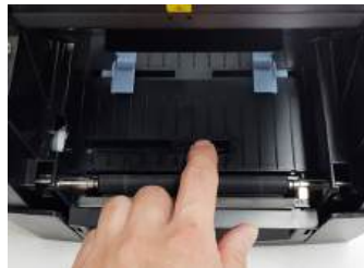
용지 타입 자동 감지