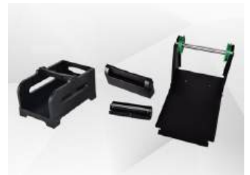
다양한 옵션 선택가능