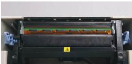
안정적인 프린thead 디자인

또한 다양한 통신사양(USB, RS-232, Ethernet)과 액세서리(라벨롤 홀더, 커터모듈, 필러 모듈)로 제품의 호환성을 높였습니다.