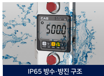
IP65 방수·방진 구조