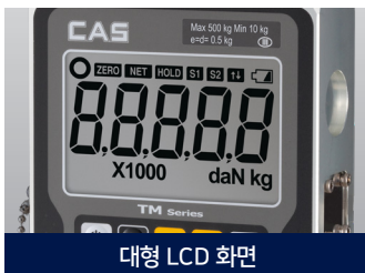
대형 LCD 화면