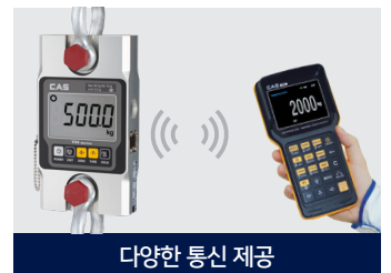
다양한 통신 제공