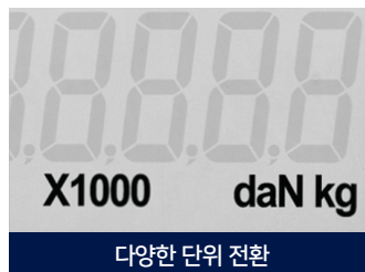
다양한 단위 전환