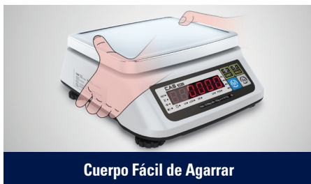
Cuerpo Fácil de Agarrar

Como una balanza de pesaje simple con una resolución máxima de 1/15,000, el SW-II es adecuado para una variedad de entornos comerciales, incluyendo mercados tradicionales, gracias a su diseño compacto y ergonómico.