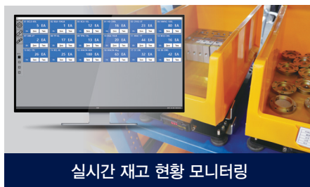
실시간 재고 현황 모니터링