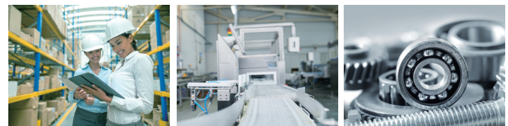
자재 창고 재고 관리