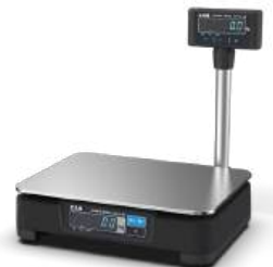
PDN 사용자 디스플레이 타입