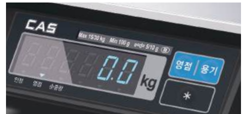
고휘도 LED 디스플레이 적용