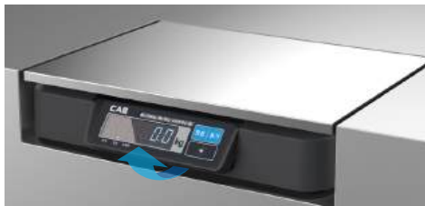
틸팅 디스플레이 및 저상형 구조