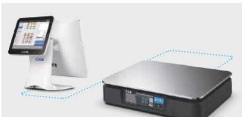
POS 및 ECR 시스템 연결

저상형 구조로 사용공간을 효율적으로 활용할 수 있고, 고휘도 LED 디스플레이로 시인성이 좋습니다.