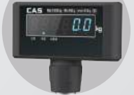
듀얼 디스플레이 (선택사양)