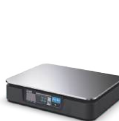
PDN 기본 타입