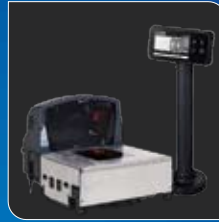
다양한 ECR system과 연결 가능