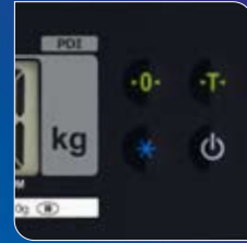
손쉬운 키 조작