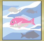
재료 신선도 유지