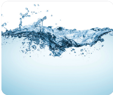
식수 및 수영장