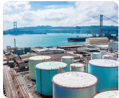
기타 산업 분야