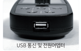
USB 통신 및 전원어댑터