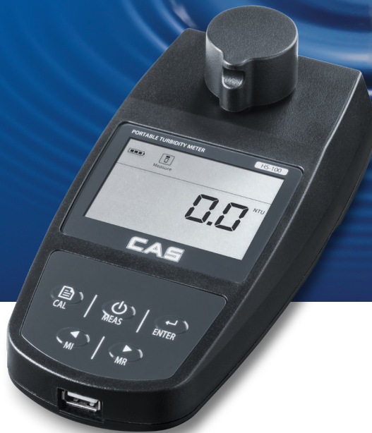
HS100 Portable Turbidity Meter