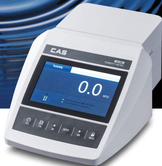
HS200 Benchtop Turbidity Meter