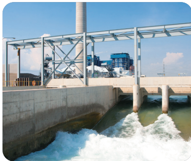
산업 폐수 처리장