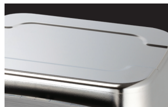
足够大的不锈钢秤盘