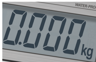
高分辨率和快速计量功能