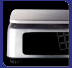
스테인레스 스틸 바디