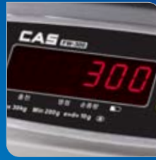
밝고 선명한 LED 디스플레이