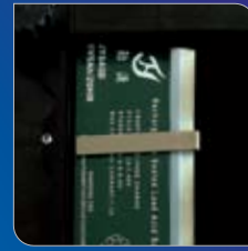
충전식 배터리 사용