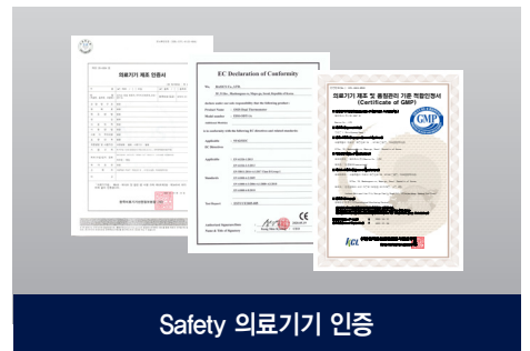
Safety 의료기기 인증