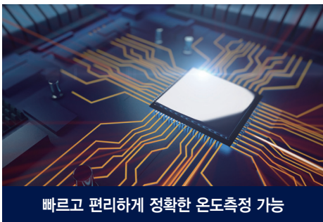
빠르고 편리하게 정확한 온도측정 가능

비접촉 체온계는 귀 및 피부를 통한 체온 측정이 모두 가능한 조합형 체온계입니다. 단, 1초! 빠르고 편리하게 비접촉 체온계를 통해 소중한 사람의 체온을 정확하게 측정하세요.