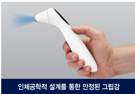
인체공학적 설계를 통한 안정된 그립감