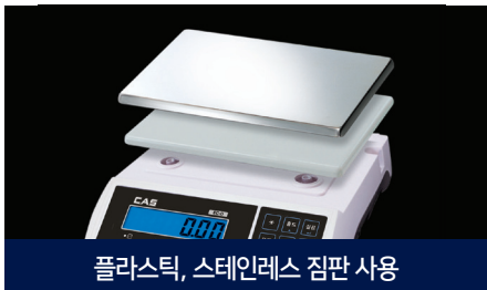
플라스틱, 스테인레스 집판 사용

EC-D Series는 기존의 단순중량저울과 비교해 높은 분해능과 다양한 기능을 갖춘 저울입니다. 실험실, 약세서리 시장, 야채가게 등 다양한 환경에서 사용이 가능하며, 충전용 배터리를 사용하여 오픈마켓에도 적합한 저울입니다.