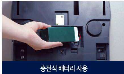
충전식 배터리 사용