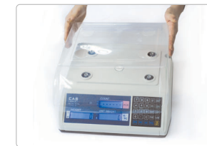
먼지 보호 커버 ▲