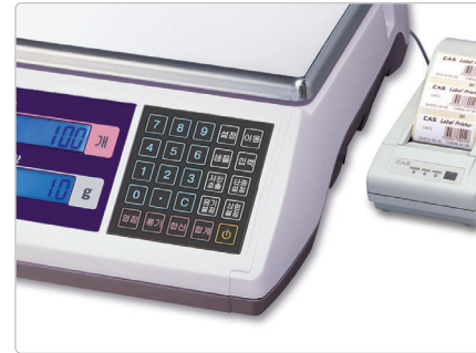
*본 제품은 총 10개의 라벨 포맷을 지원합니다.