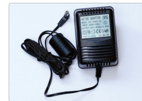
AC 어댑터 ▲