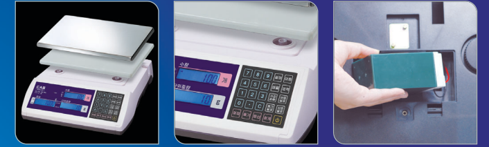
플라스틱&스테인레스 집판사용 부드러운 Rubber 스위치 사용 충전식 배터리 사용