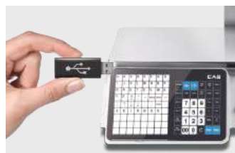
Actualización de Firmware a Través de Dispositivo USB