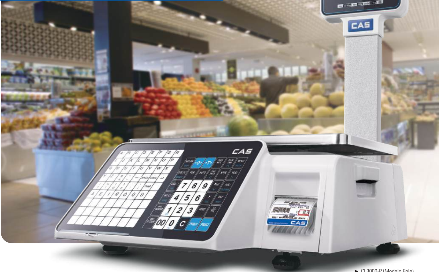
► CL3000-P (Modelo Pole)

La nueva Balanza con Impresión de Etiquetas CL3000.