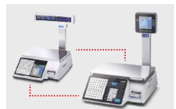
Compatible con Serie CL