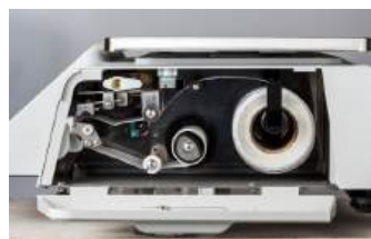
Impresión de Etiquetas Sin Forro (Opcional)