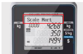
Barra de Mensajes Desplazables